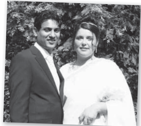
Le mariage de ma sœur