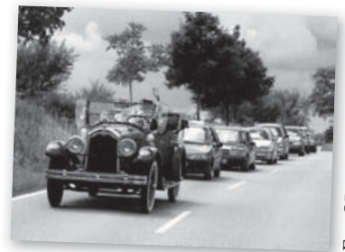
On prend la route.