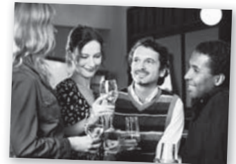
Petite fête entre voisins